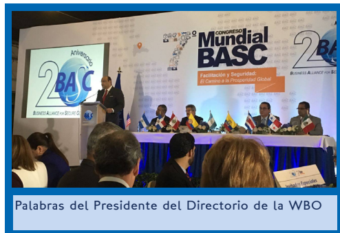
Palabras del Presidente del Directorio de la WBO

BASC PERÚ participó este 14 y 15 de setiembre en uno de los eventos más importantes, dedicado a la seguridad en la cadena de suministro del comercio exterior, "EL 7° Congreso Mundial BASC", denominado "Facilitación y Seguridad, el camino a la Prosperidad Global", el cual se realiza cada dos años en los países donde están presente los Capítulos BASC, este año se llevó a cabo en BASC República