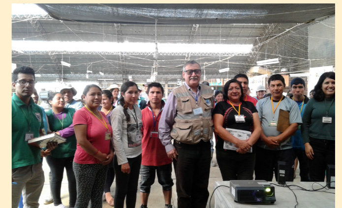
Auditoría de Recertificación a la empresa Corporación Roots S.A. (Sede Caraz)