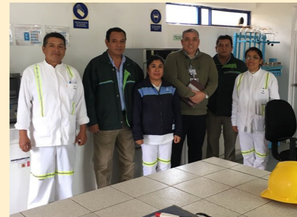
Auditoría de recertificación a la empresa Tecnológica de Alimentos S.A.(Sede Pisco Norte)

BASC PERÚ realizó 82 auditorías en el mes de setiembre: 59 Auditorías de Recertificación, 09 Auditorías de Certificación, 04 Auditorías de Control y 10 Registros iniciales, con el fin de verificar la implementación y el mantenimiento del Sistema de Gestión de Control y Seguridad (SGCS) BASC con respecto a la Norma BASC V04-2012 y el Estándar correspondiente.